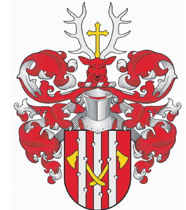
R. Bimbos sukurtas herbas.