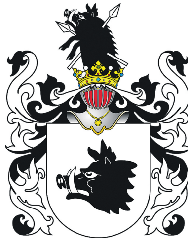
Stanislovo Ernesto Denhofo herbas.